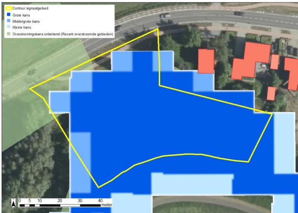
Figuur: De blauwe contouren geven de huidige overstromingskans weer. Hoe donkerder blauw, hoe groter de overstromingskans. De groene contour geeft de recente overstroomde gebieden (ROG) weer, waar geen specifieke overstromingskans gekend is.