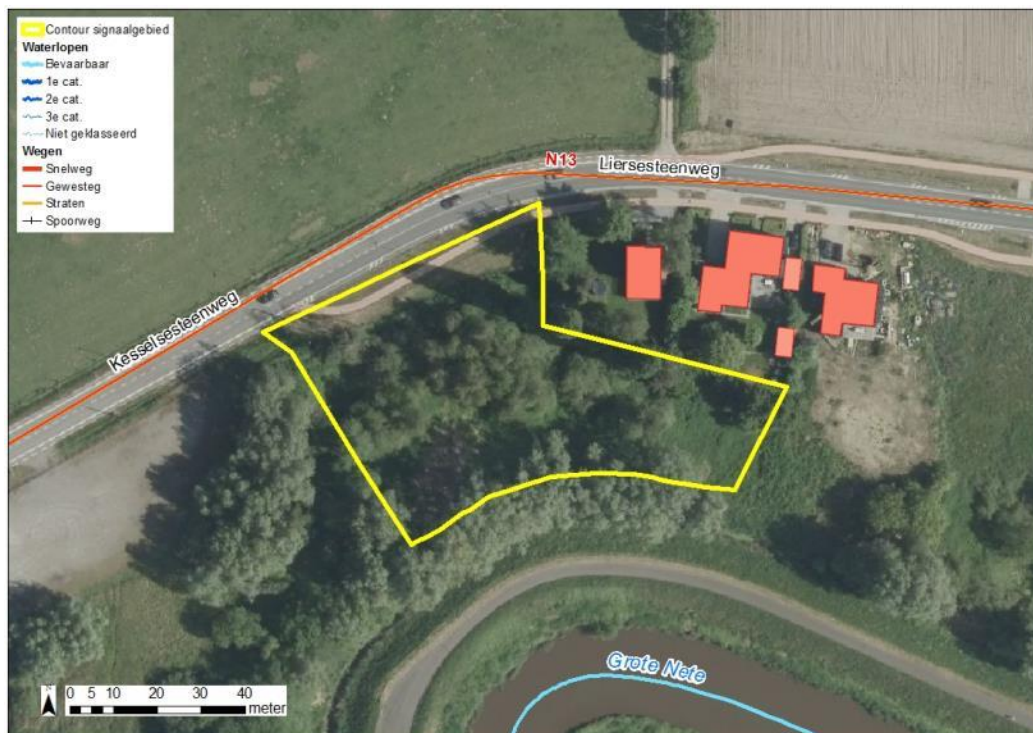
Figuur: situering signaalgebied op orthofoto (medio 2015) met aanduiding van gewestwegen, straten, waterlopen en de bebouwingstoestand volgens het Grootchalig Referentiebestand GRB.