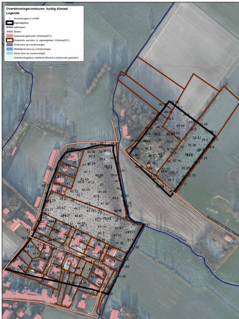
Handleiding kaart: De weergave van de kadastrale gebouwen (Cadmap 2011), kadastrale percelen (Cadmap 2011), straten en waterlopen geven een situering van het signaalgebied. De terreinhoogtes uitgedrukt in mTAW geven een indicatie van het maaiveldniveau. De blauwe contouren

Het signaalgebied is gelegen buiten de ORL-overstromingsgevaarkaarten (voorlopige kaarten, goedgekeurd op CIW-vergadering van december 2012) en de kaart van recent overstroomde gebieden (ROG-kaart).