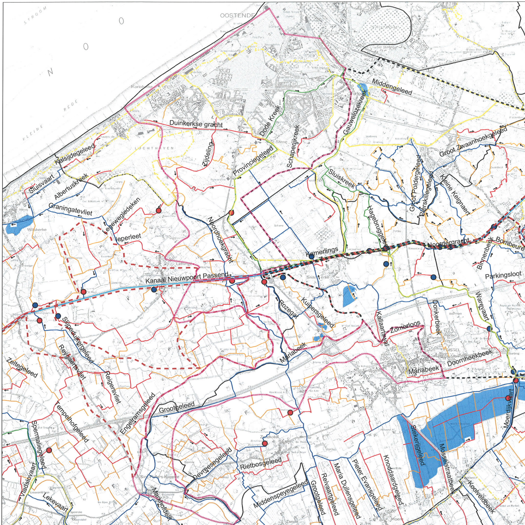
Figuur 38 Detailkaart van het stroomgebied van het Provinciegeleed - de Dode Kreek